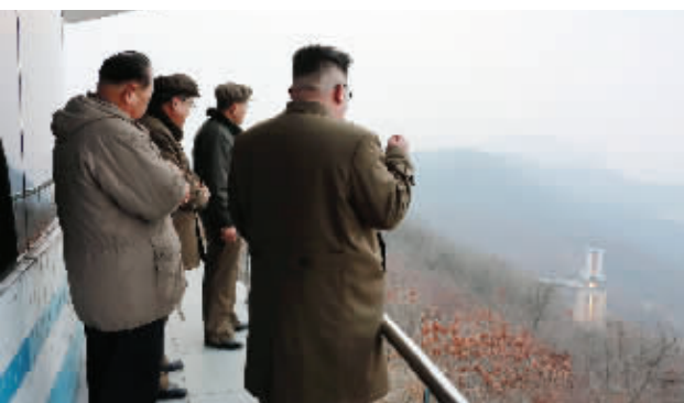
这张朝中社3月19日提供的照片显示,朝鲜3月18日凌晨在西海卫星发射场进行了新型大功率火箭发动机的地上点火试验。朝鲜最高领导人金正恩(右一)现场指导试验。

报道说,新开发的大功率火箭发动机由朝鲜国家科学院研制,比以往的发动机推力更大,是首次进行地上点火试验。此次试验的目的是验证燃烧室的推力性能、涡轮泵的运转精确性、控制系统的安全性和可靠性等大功率