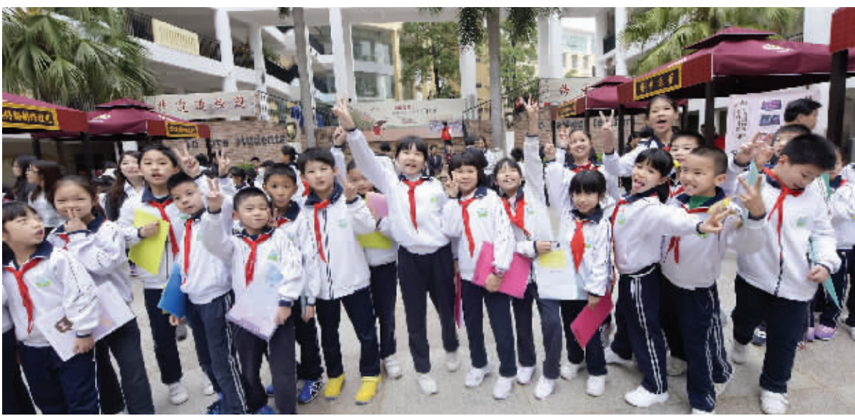
3月16日,2017年东莞非遗进校园的首场活动在莞城英文实验学校举行